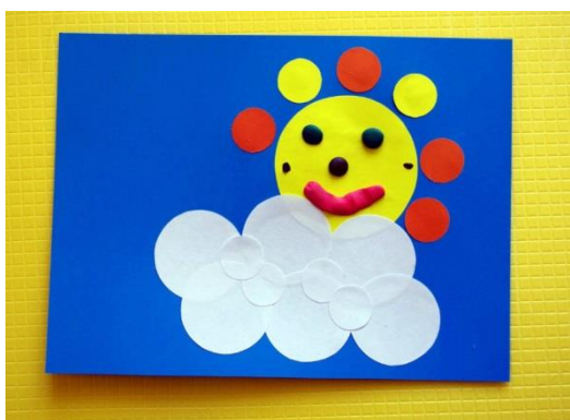
Аппликация из кругов