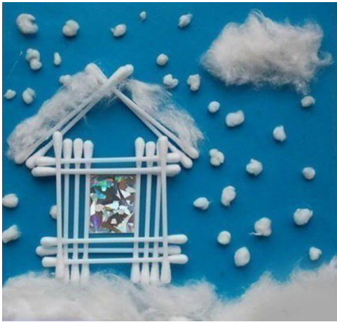
Аппликация домик из ватных палочек и ваты