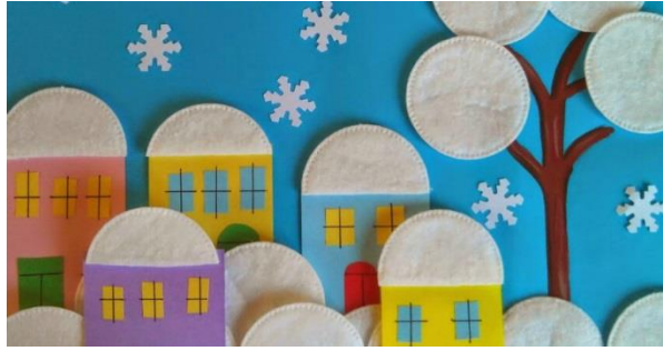
Аппликация из ватных дисков