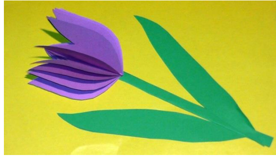
Аппликация цветок объемная