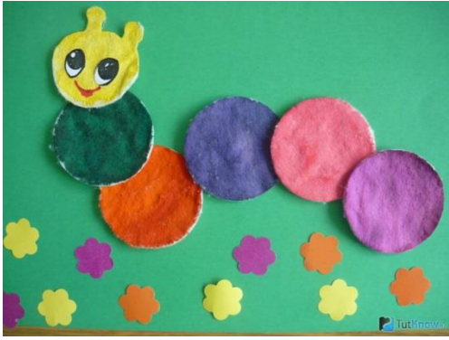
аппликация из ватных дисков